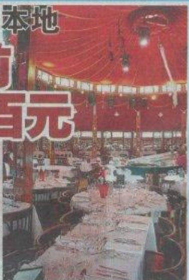
镜子剧场用高装置了约3540面镜子，气势壮观。

演出日期从今天起至3月15日，每天晚上7时(每逢星期一休息)，公众可上网www.the-crystal-mirror.com了解表演资讯详情，或致电86485055。